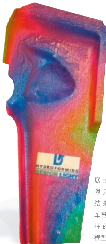
展示出有限元分析结果的卡车驾驶室B柱的三维模型

Hydroforming Design Light AB很容易就做出了从Z Corporation公司购买Spectrum Z™510型三维打印机的决定，因为任何其它公司都没有能够制作多色实体模型的打印机产品。